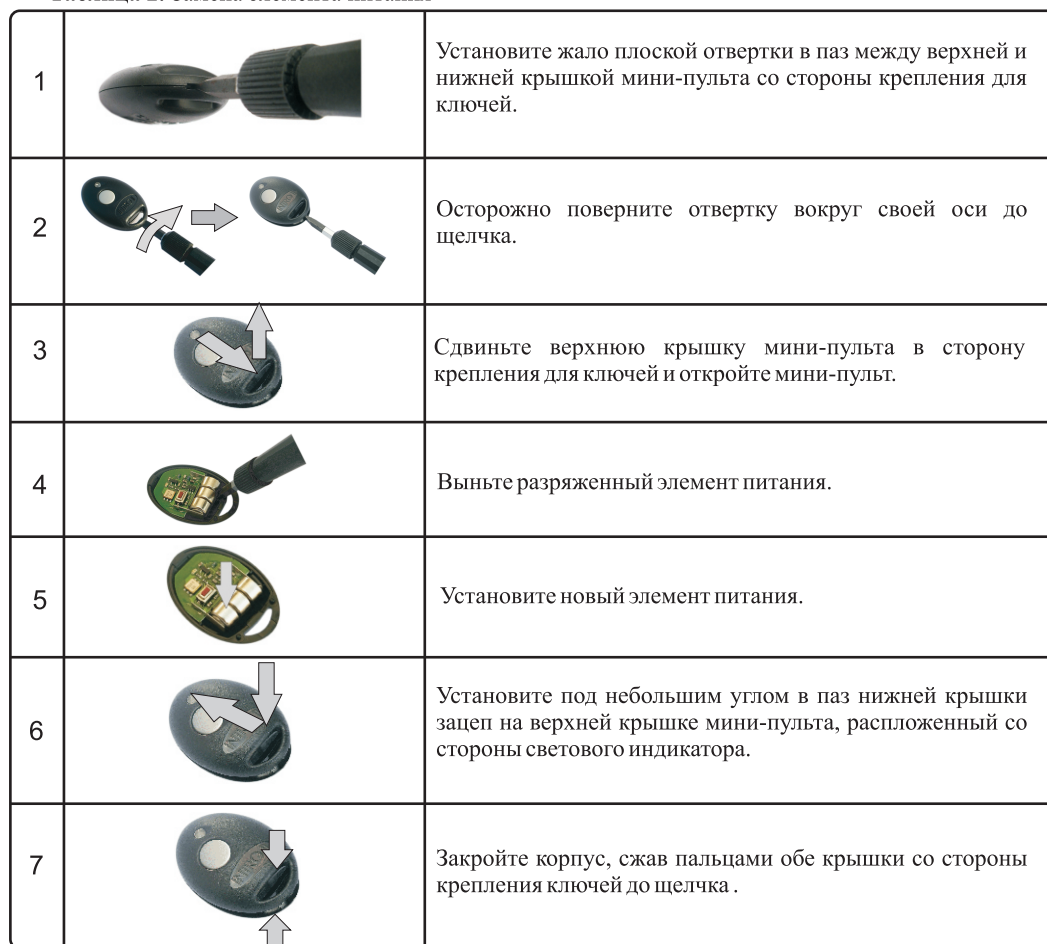
Таблица 2. Замена элемента питания